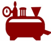
FABRICAMOS NUESTRO CHOCOLATE