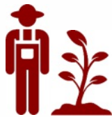
CACAO DIRECTO DE CACAOCULTORES