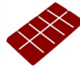
CHOCOLATE REAL SIN SUSTITUTOS